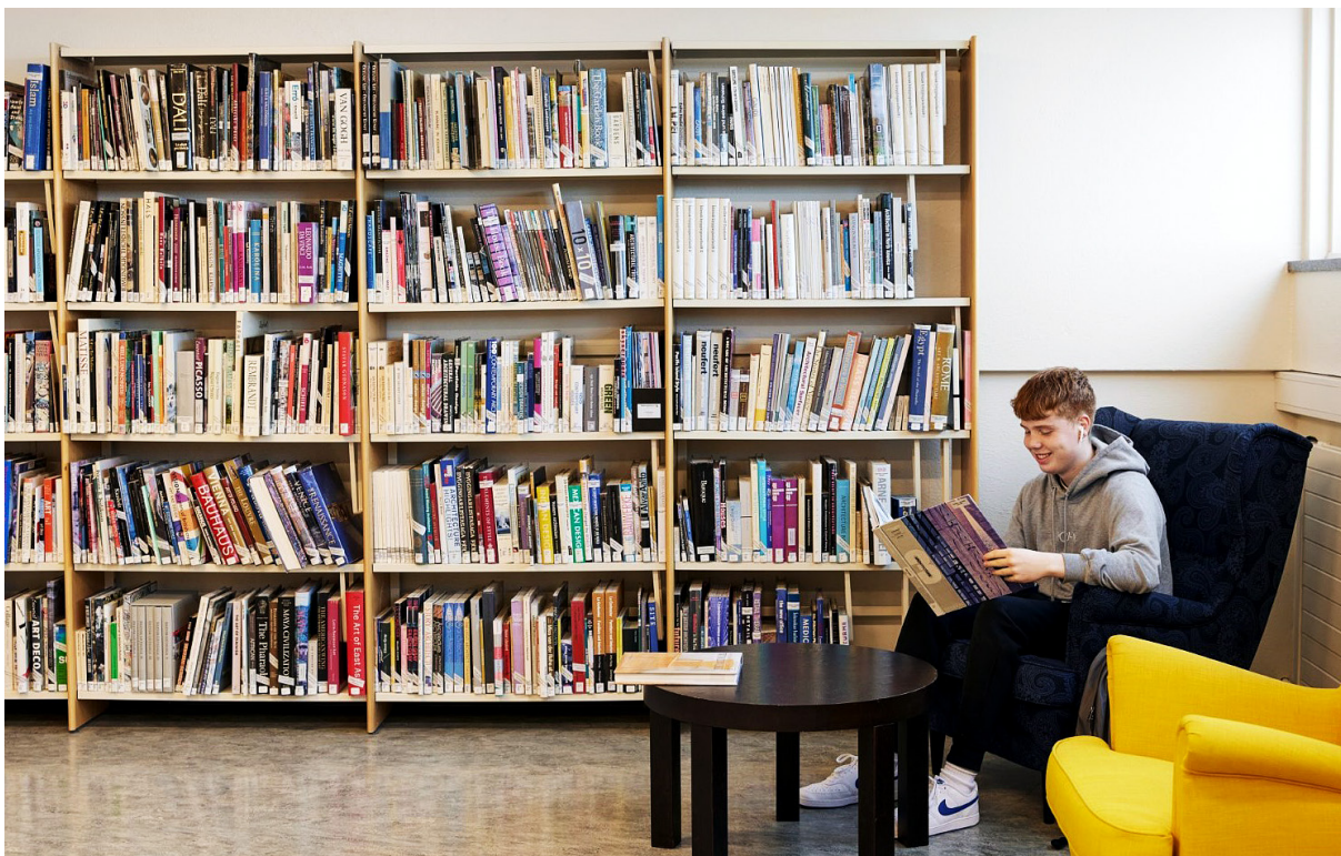
MYND 5: LESIÐ Í SKÓLANUM

Nemendur okkar nota bókasafnið mikið og þjónustan sem við bjóðum upp á verður sífellt fjölbreyttari. Við vonumst til þess að sú verði einnig raunin á nýja bókasafninu. Við viljum áfram leggja áherslu á að þar sé boðið upp á faglega upplýsingaþjónustu og fyrirtaks námsaðstöðu. Við viljum líka að nemendur komi til okkar milli kennslustunda og nýti aðstöðuna til að læra, komast í tölvu, tefla, vinna hópverkefni, lesa nýjustu bókina í manga-seríunni sinni, eða bara til að „hanga“. Framhaldsskólar eru líflegir staðir í eðli sínu og við viljum að bókasafnið endurspegli það. Á safninu á að vera pláss fyrir öll og það á að vera öruggur staður og afdrep þeirra sem finna sig ekki í erlinum í matsalnum eða öðrum nemendarymum. Bókasafnið hefur fjölbreyttu hlutverki að gegna í skólastarfinu, bæði faglegu og félagslegu, sem við hlökkum til að halda áfram að sinna og þróa. Við sjáum fyrir okkur spennandi framtíð á bókasafni Tækniskólans.