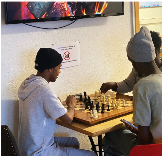
MYND 1: TEFLT Á BÓKASAFNINU

Námsefni Raftækniskólans er orðið aðgengilegt á rafbók.is. Einnig setja kennarar orðið meira af námsefni beint á Innu, kennslukerfi framhaldsskólanna. Ýmis uppflettirit eru einnig orðin aðgengileg rafrænt, til dæmis RB blöð Húsnæðis- og mannvirkjastofnunar og orðabækur á Snöru. Við sjáum því fyrir okkur aukna þjónustu kringum rafrænt efni í framtíðinni.