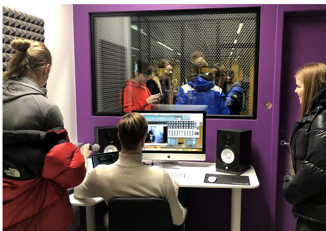
MYND 2: HLJÓÐVER

og starfsfólki skólans. Öllum er velkomið að nýta rýmið til náms og kennslu, alveg eins og bókasafnið. Það hefur verið mikill samgangur milli bókasafnsins og framtíðarstofunnar frá upphafi og árið 2020 var opnað útibú frá framtíðarstofunni inni á bókasafni skólans í Hafnarfirði. Í ljósi þess hversu mikla samleið þjónusta bókasafnsins á með þjónustu framtíðarstofunnar var í ár ákveðið að hún skyldi formlega tilheyra bókasafninu í innra skipulagi skólans.