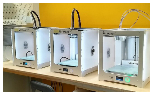
MYND 3: ÞRÍVÍDDARPRENTARAR

bókasafninu en við förum líka inn í kennslustundir. Við heimsækjum sem dæmi íslenskuhópa þar sem við notum veggspjald frá IFLA (International Federation of Library Associations and Institutions) sem eins konar leiðarvísi í kennslu um upplýsingalæsi. Þar förum við yfir greiningu upplýsinga og gagnsemi, kennum nemendum að þekkja áróður, auglýsingar o.s.frv.