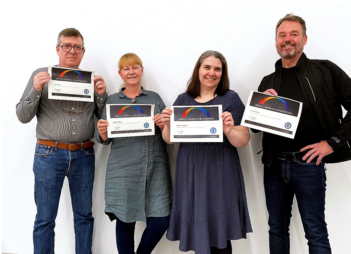
MYND 10: STARFSFÓLK LANDSKERFIS BÓKASAFNA MEÐ NÝFENGIN KERFISSTJÓRNUNARRÉTTINDI Í ÖLMU

Einn mælikvarði til að meta umfang þjónustu við viðskiptavini eru innsend þjónustuerindi. Verkbeiðnir frá starfsmönnum safna í júní 2022 nánast fimmfölduðust miðað við sama tíma árið á undan. Tvöföldun varð á verkbeiðnum í ágúst á milli árána 2021 og 2022. Þetta er annars vegar sá mánuður þegar nýja kerfið var tekið í notkun og hins vegar mánuðurinn þegar grunnskólarnir hófu störf að afloknu sumarleyfi.