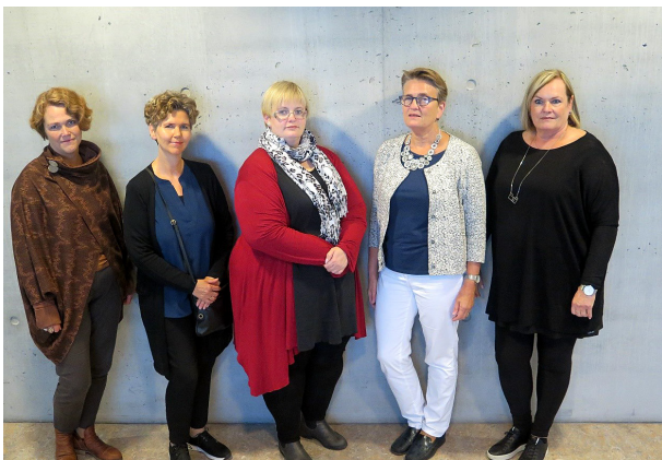
MYND 3: SÉRFRÆÐIHÓPUR 3