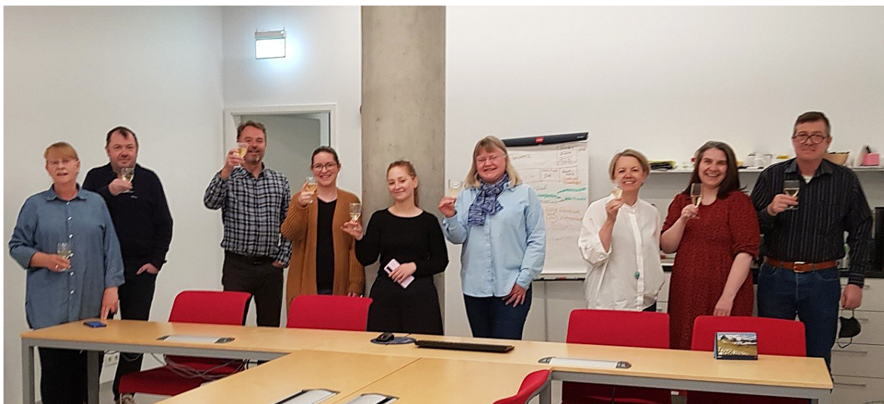
MYND 9: STARFSFÓLK LANDSKERFIS FAGNAR KERFISOPNUN Í JÚNÍ 2022