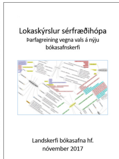
MYND 6: LOKASKÝRSLA SÉRFRÆÐIHÓPA

búningur næsta fasa. Í júní komu fulltrúar bjóðenda til landsins og tóku þátt í seinni fasa útboðsferlisins sem fólst í úrlausn fyrirfram skilgreindra notkunardæma. Þar var látið reyna á hversu vel virkni kerfanna félli að kröfum og verklagi, svo sem varðandi útlán og lánþega, lýsigögn, umsýslu, leit og kerfislega uppsetningu. Dómnefnd, sem skipuð var sérfræðingum úr hópi aðildarsafna Gagnis auk Landskerfis bókasafna, mat úrlausn þessara verkefna og gildi niðurstaðan 32% í vallíkani. Þegar einkunnir dómnefnda lágu fyrir voru verðumslög opnuð en verð vigtaði 48% í vallíkani. Útreikningar leiddu í ljós að tilboð Ex Libris var heldur hagstæðara en tilboð Innovative í kaup á hugbúnaði. Leigutilboð Innovative var hins vegar óhagstæðast. Þegar hér var komið sögu ákvað stjórn Landskerfis bókasafna að óska eftir skýringar- eða samningaviðræðum við bjóðendur, líkt og gefinn er kostur á í samkeppnisútboði eins og hér var um að ræða. Var það í takt við ábendingar frá Ríkiskaupum um að í flestum tilfellum skiluðu slíkar samningaviðræður kaupendum lægra verði og betri niðurstöðum. Um miðjan september gerðu bjóðendur sér aftur ferð til Reykjavíkur fyrir viðræður þar sem leitast var við að ná gagnkvæmum skilningi á þörfum íslensks bókasafnasamlags og möguleikum kerfanna á að uppfylla þær. Skýringaviðræður héldu áfram um nokkurt skeið í formi símafunda og tölvupóstsamskipta og á endanum kölluðu Ríkiskaup eftir og tóku við nýjum tilboðum frá bjóðendum.