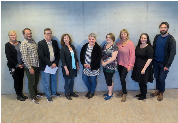
MYND 1: SÉRFRÆÐIHÓPUR 1

legir bjóðendur. Fimm aðilar svöruðu könnuninni en það voru Ex Libris, Infor, Innovative Interfaces, OCLC auk Systematic í samstarfi við EBSCO. Fylgst hafði verið með þróun opins hugbúnaðar svo sem FOLIO kerfisins en þróun þess var ekki nógu langt komin til að það gæti talist raunhæfur valkostur.