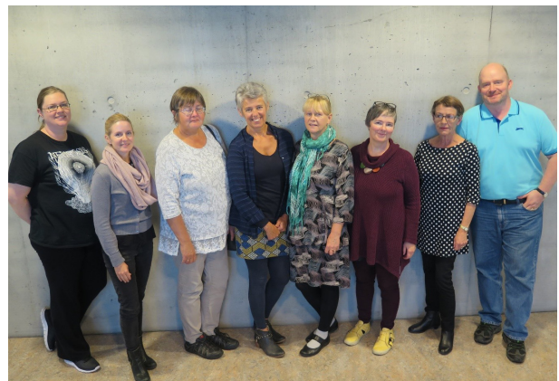
MYND 4: SÉRFRÆÐIHÓPUR 4