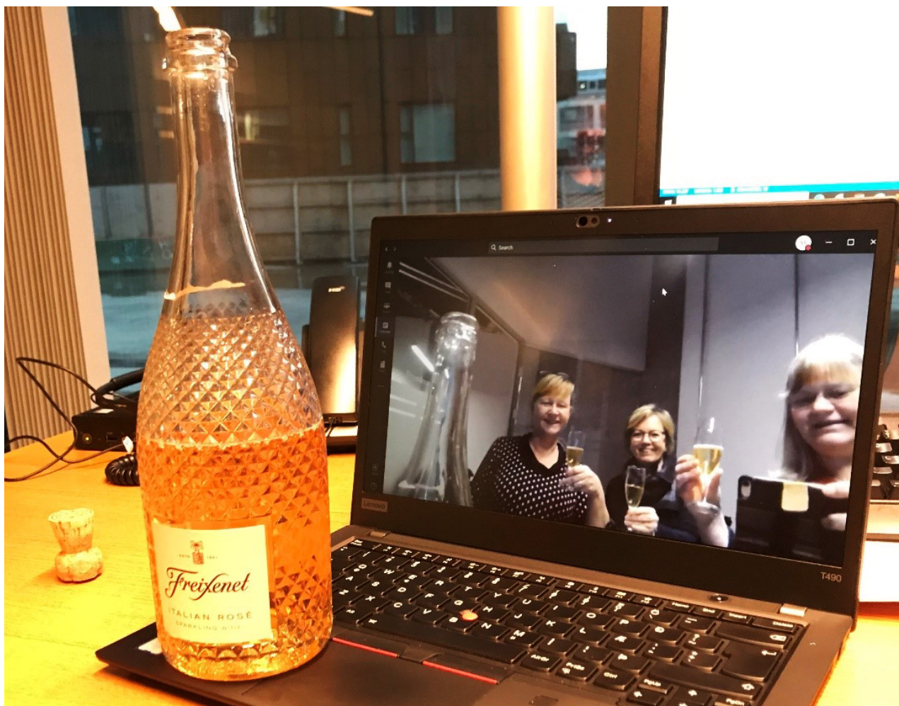
MYND 8: SAMNINGUM MILLI LANDSKERFI BÓKASAFNA OG EX LIBRIS FAGNAÐ Á FJARFUNDI

Stofnkostnaður við kerfisinnleiðingu hljóðaði upp á tæpar 44 m.kr. í samningi og árlegt þjónustugjald eftir gangsetningu reiknaðist í kringum 42 m.kr. Samningurinn er til átta ára með möguleika á framlengingu um fjögur ár þannig að samningstími getur teygst sig í tólf ár ef áhugi verður á því.