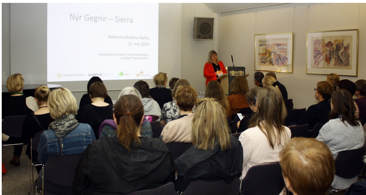
MYND 7: KYNNING Á SIERRA BÓKASAFNSKERFINU, NOTENDARÁÐSTEFNA ALEFLIS 2019

Árið 2019 hófst með útboði á hýsingu fyrir Sierra bókasafnskerfið og niðurstaða þess var að samið var við Advania. Sierra kerfin þrjú voru sett upp í hýsingarumhverfi Advania, eitt fyrir almenningsbókasöfn, annað fyrir skólasöfnin og það þriðja fyrir háskóla-, framhaldsskóla- og sérfræðibókasöfn. Samlagsvirkni átti síðan að koma í gegnum Inspire Discovery sem myndi tengja Sierra kerfin saman auk þess að vera leitargátt út á við. Strax og Sierra var uppsett var hafist handa við kerfisvinnu ýmis konar svo sem kerfisstillingar, gagnavarpanir, vinnuflæði fyrir skráningu og viðhald lánþegaskrár. Vinnan fór fram í tengslum við fundi og námskeið sem Innovative hélt fyrir Landskerfi og valda sérfræðinga í ágúst og nóvember. Þessu til viðbótar voru haldnar vinnustofur í húsakynnum Landskerfisins þar sem sérfræðingar Innovative leiddu umræður um þróun leitargáttarinnar, samlagsvirkni og samþættingu við önnur kerfi. Niðurstöðurnar voru skjalaðar og var hönnunarlýsing leitargáttarinnar á lokametrunum. Í árslok 2019 var verkefnið í góðum farvegi. Gert var ráð fyrir gangsetningu kerfa fyrir mitt ár 2021.