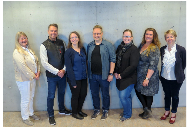
MYND 2: SÉRFRÆÐIHÓPUR 2