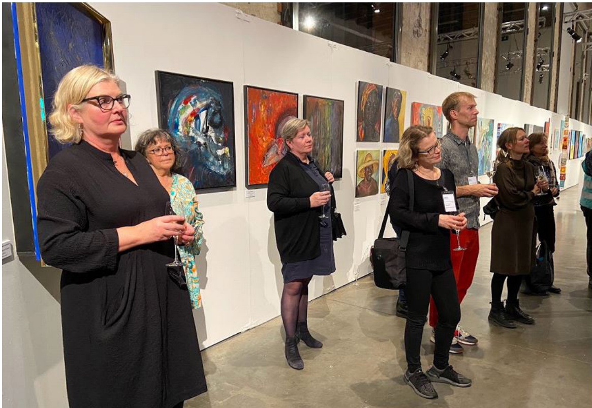
MYND 6: Í MÓTTÖKUNNI Á WUNDERKAMMER