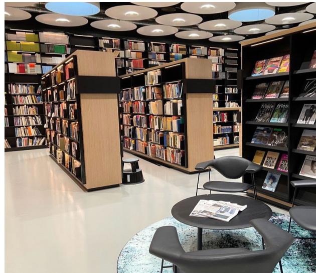
MYND 10: BÓKASAFNIÐ Í MUNCH SAFNINU

Það sem lifir í minningunni eftir að hafa farið á ráðstefnu sem þessa eru ekki aðeins fyrirlestrarnir og erindin heldur umhverfið. Það að fá tækifæri til að heimsækja þessi nýju söfn, skoða sýningar sem þar eru og fá að kynnst og fræðast um bókasöfn safnanna er eitthvað sem ekki er á færi gesta sem koma inn af götunni til að skoða listsýningarnar sem uppi eru hverju sinni.