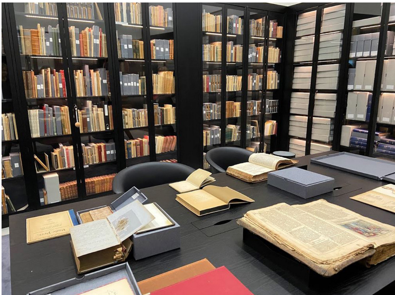
MYND 8: GÖGN ÚR FÓRUM EDVARÐS MUNCH

Ráðstefnunni lauk með skoðunar- og kynnisferð um hið nýja Munchsafn sem staðsett er í næsta nágrenni tónlistarhússins og nýja borgarbókasafnsins. Þar var leiðsögn um bókasafn listafnsins en þar er meðal annars heilmikið safn bóka sem Munch átti. Í listafninu var, eins og við var að búast, sýning á verkum Edvarðs Munch og einnig settur upp hluti af heimili hans. Auk þess var þarna tímabundin sýning á verkum samtímalistamanna. Hús safnsins stendur á skemmtilegum stað og á efstu hæðinni er fallett útsýni yfir miðbæinn, allt frá höfninni og upp til fjalla. Vel má t.d. sjá þaðan, skíðastökkpallinn á Holmenkollen.