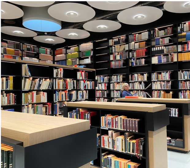
MYND 9: BÓKASAFNIÐ Í MUNCH SAFNINU