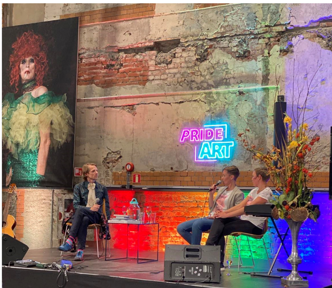
MYND 5: DAGSKRÁ Á WUNDERKAMMER