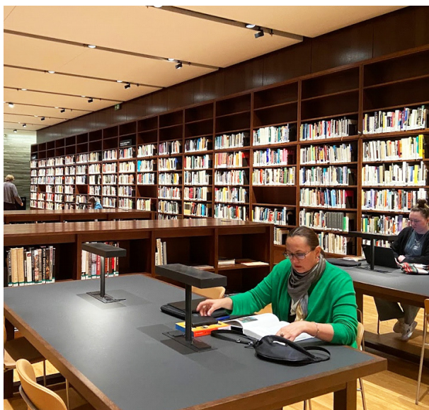
MYND 3: BÓKASAFN NATIONAL MUSEUM