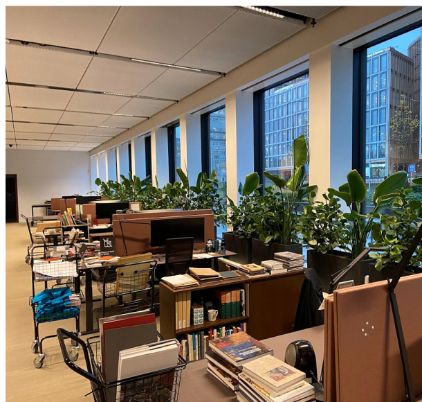
MYND 4: VINNURÝMI STARFSFÓLKS BÓKASAFNS NATIONAL MUSEUM