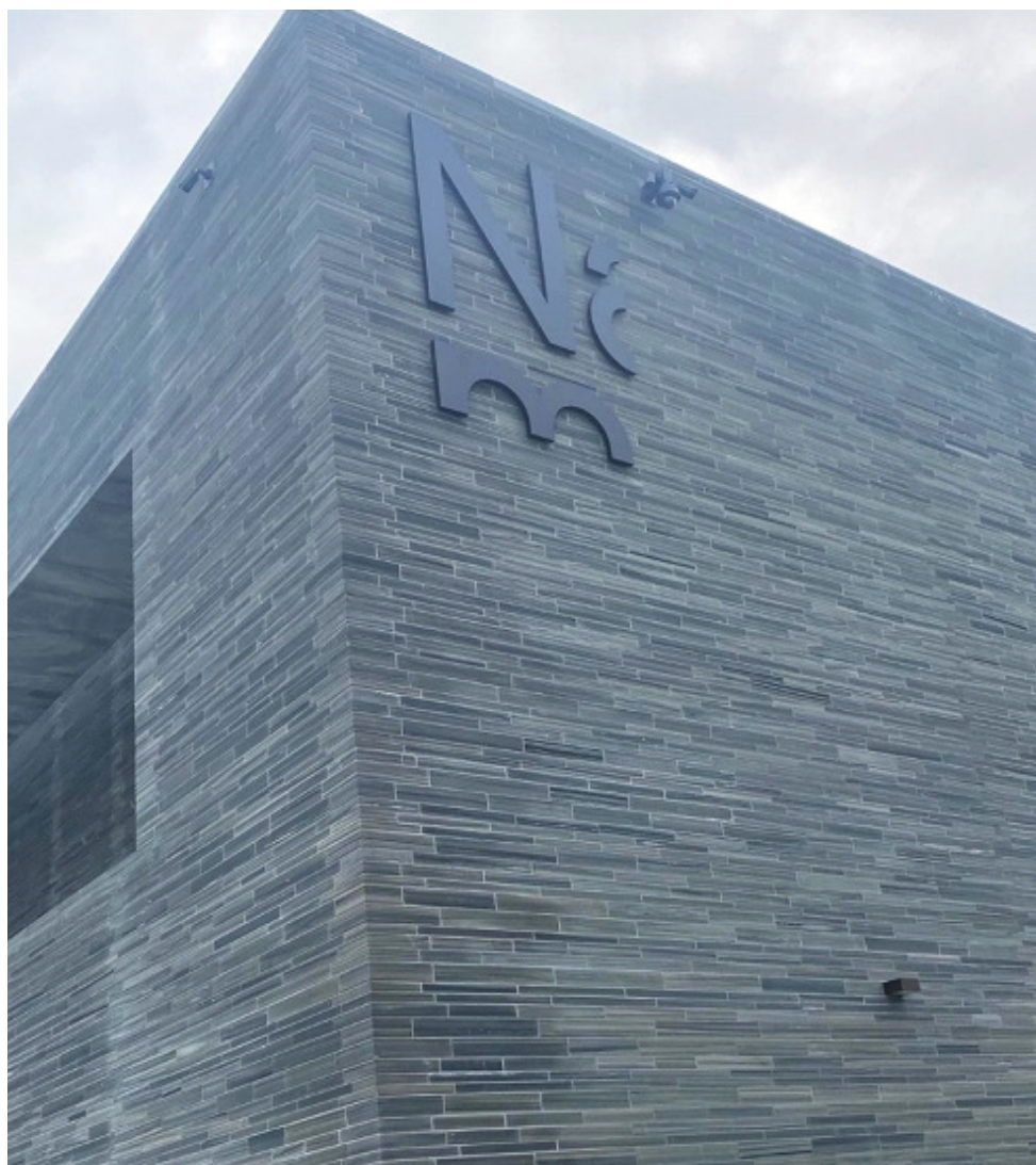
MYND 1: NATIONAL MUSEUM OSLO

Yfirskrift ráðstefnunnar 2022 var Queer art and knowledge management sem tengist því að í Noregi var árið tileinkað hinsegin fólki, Skeivt kulturår 2022 . Ráðstefnan var haldin í nýju og veglegu húsnæði listasafns Norðmanna, the National Museum of Art, Architecture and Design . Safnið var formlega opnað þar fyrr á árinu.